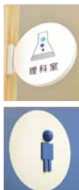
S小学校 SDA入選 地区デザイン賞