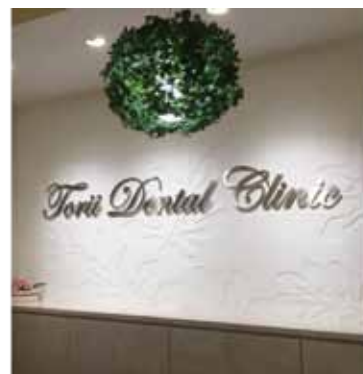
鳥居デンタルクリニック