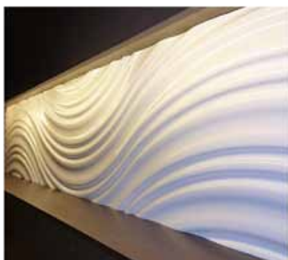
やきとり専門 串鳥