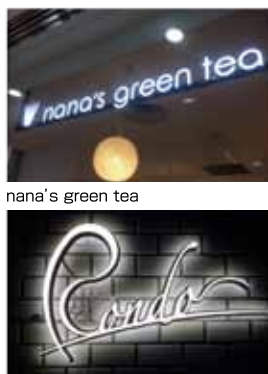
株式会社Design Atelier 円舞