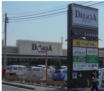
デリシア 長野県内全店