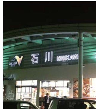
高速道路SA、PA 中日本高速道路、東日本高速道路