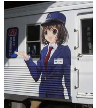
電車ラッピング 長野県 上高地線