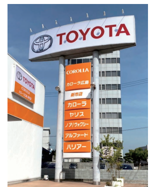
トヨタカローラ広島