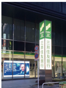
三井住友銀行 東京・神奈川・愛知・大阪・兵庫