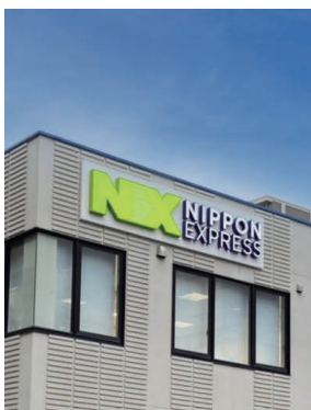
NIPPON EXPRESSホールディングス 福岡・山口・広島・岡山・鳥取・香川