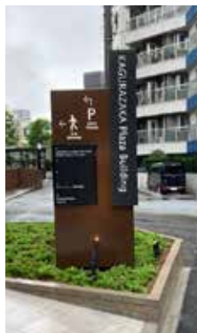
神楽坂プラザビル (東京)