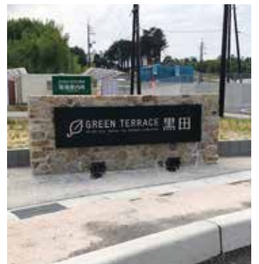
グリーンテラス黒田 (島根)