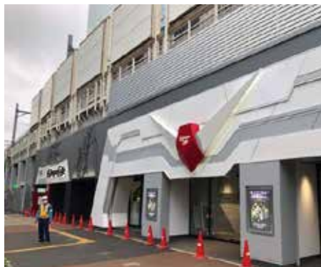
ガンダムカフェ Vアンテナ・文字サインなど (東京)