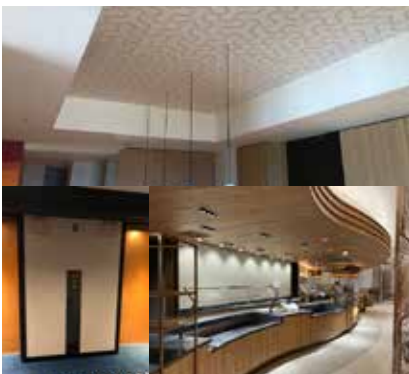
ヒルトンホテル EVボタンP・アクリルP・天井クロスなど (千葉・大阪・名古屋・沖縄)