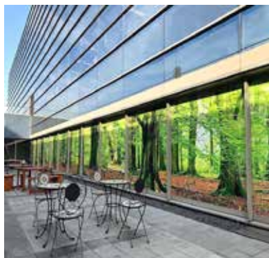
ウィンドウサイン