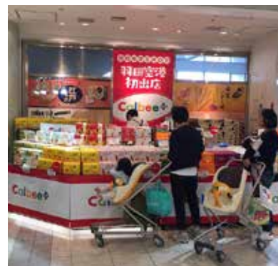
空港イベント・催事