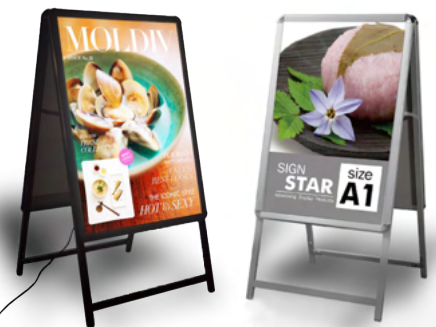
A型LEDパネル看板 A型スタンド看板