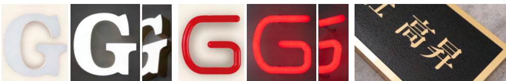
金属チャンネル文字(縁なし内照タイプ) 樹脂チャンネル文字(LEDネオン形タイプ) エッチング銘板