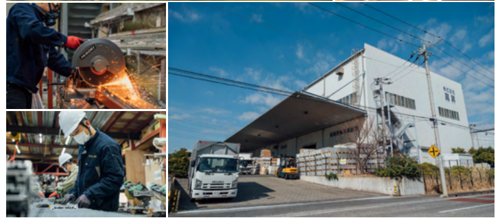
原木工場(建物床面積3,845㎡)