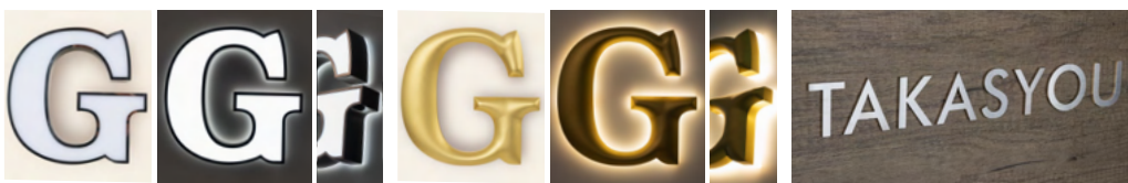
金属チャンネル文字(縁あり内照タイプ) 金属チャンネル文字(バックライトタイプ) ステンレス切り文字