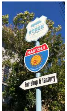
ストックガレージ