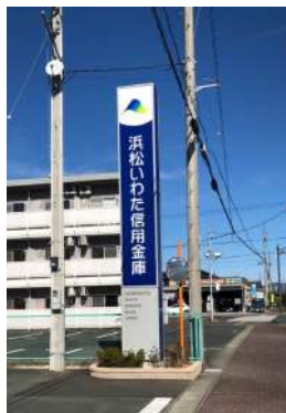
浜松いわた信用金庫