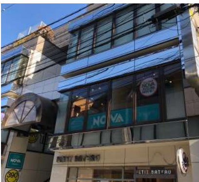
NOVAホールディングスチェーン 東京・埼玉・千葉・茨城・群馬・栃木 神奈川・静岡・山梨・愛知・三重・岐阜