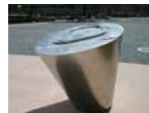
郡山総合運動場開成山野球場