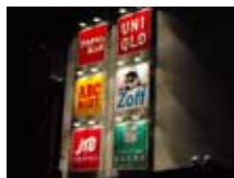
ララガーデン(仙台)