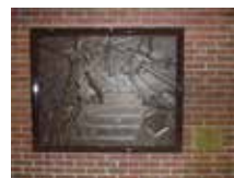
東日本大震災復興レリーフ