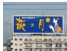
秋の月(屋上広告塔)