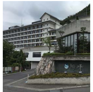
翔峰 長野県松本市