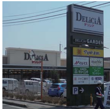
デリシア 長野県内全店