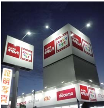
カメラのキタムラ 長野・山梨・埼玉・群馬・富山・石川・福井・静岡