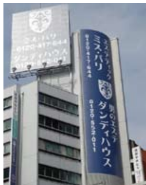
ミス・パリ ダンディハウス