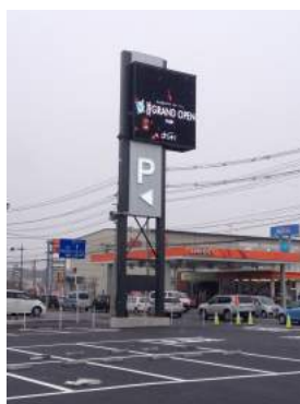
カオス佐沼店 宮城県登米市