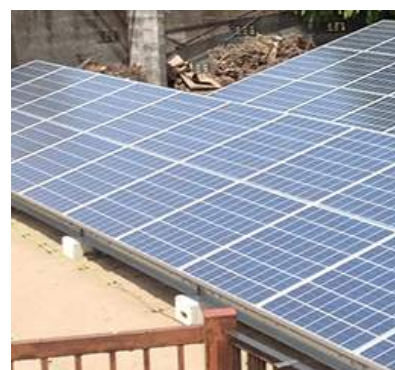
太陽光発電システム 宮城県大崎市