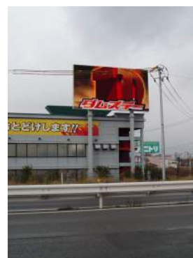
ダムズ 新潟県新潟市