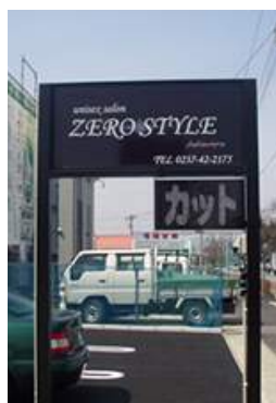
ZERO STYLE 山形県東根市