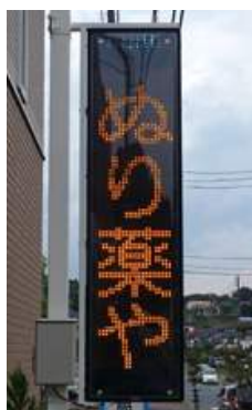
マリン薬局 福島県いわき市