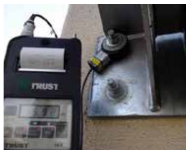
基地局アンテナ設置工事

製品の設計・開発から販売、レンタルなど、多種多様な課題の解決に柔軟に対応するため、幅広い製品を扱っています。 また、施工や試験・検査はもちろんのこと、これまで培ってきた知見を生かしたコンサルティングもおこなっています。