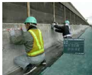
名神高速道路 水堂高架橋壁高欄補強工事