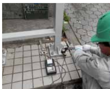
プロミス平野郵便局前 看板検査