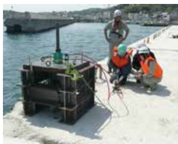
岩屋港防波堤(東)改良工事