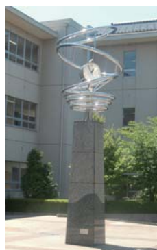
時計塔モニュメント 石川県 津幡南中学校