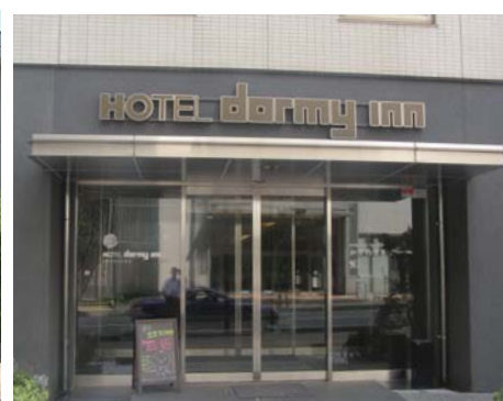
ドリーミーインホテル金沢 金沢市 金沢駅前