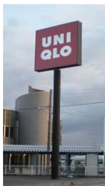
ユニクロ 北陸エリア