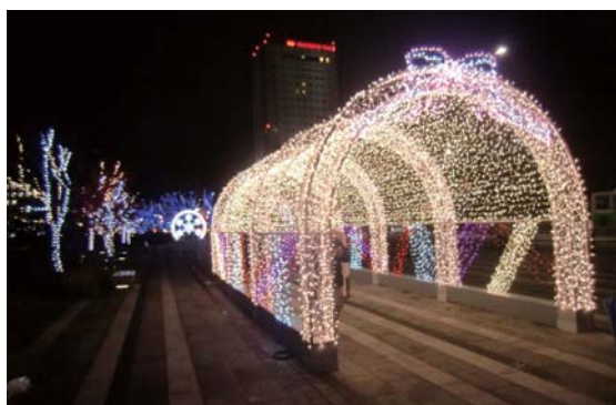
富山・イルミネーション 富山市城趾公園