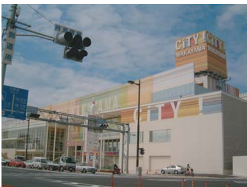
CITY! WAKAYAMA (和歌山市)