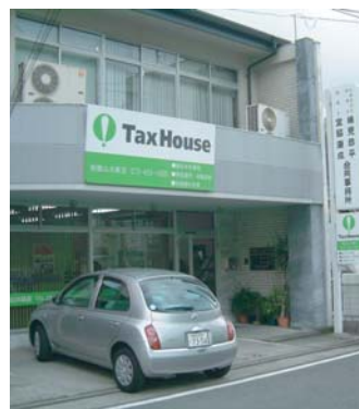
Tax House (和歌山市)