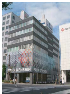
パーク信信ビル (和歌山市)