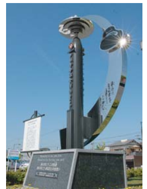
少林寺拳法創始60周年記念 モニュメント