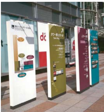
高松サポートシンボルタワー