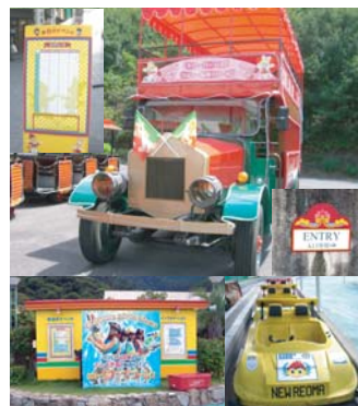
ニューレオワールド(大江戸温泉) リニューアル工事