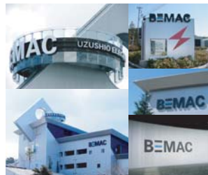
渦潮電機野間工場(みらい工場)