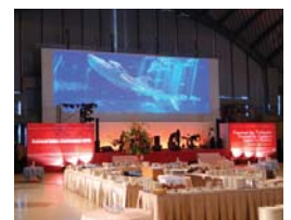
インセンティブパーティー (イベント)