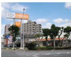
トヨタカーロー沖縄