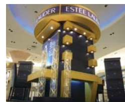
DFS GALLERIA OKINAWA (ディスプレイ)