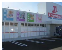
ドラッグイレブン