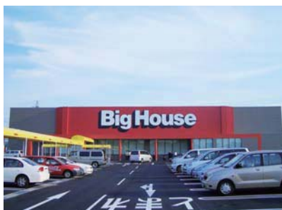
■BigHouse (21店舗) 岩手・宮城・千葉 ※写真は千葉県