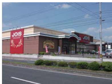
■JOIS (30店舗) 岩手・秋田 ※写真は岩手県