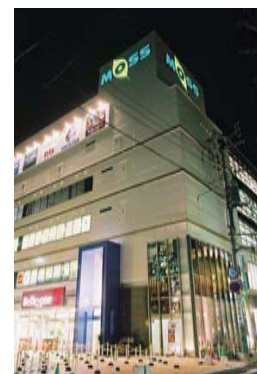
■MOSSビル (複合施設) ※写真は岩手県