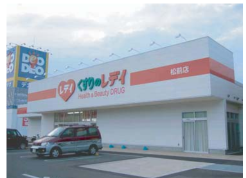
レデイ薬局 全店(愛媛・香川・高知・徳島・広島)