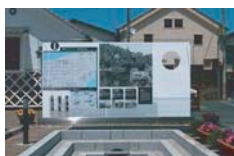
大洲市観光案内サイン(愛媛)