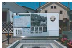
大洲市観光案内サイン(愛媛)