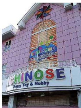
おもちゃのイチノセ