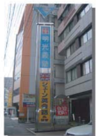
明光義塾 九州全県・山口・広島