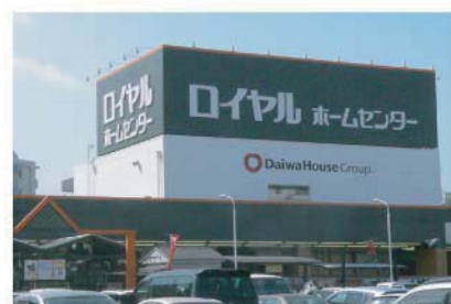
ロイヤルホームセンター