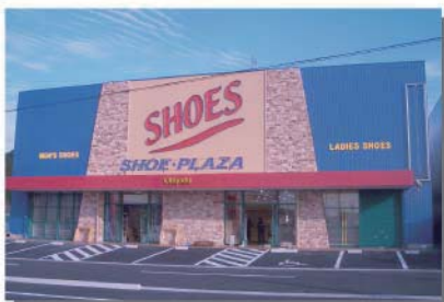
シュープラザ 九州全県