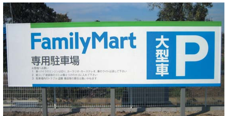
■パワーフレーム 施工例3