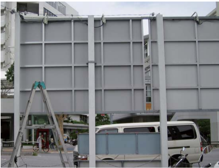
■パワーフレーム 施工例1