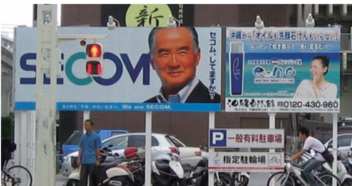
■パワーフレーム 施工例2