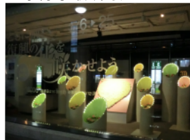
ショーウィンドウディスプレイ