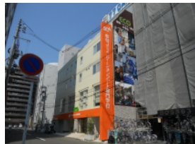
専門学校外装サイン