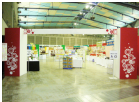
新商品展示試食会造作