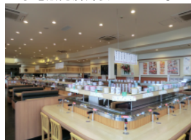
回転寿司店舗内装工事