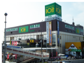
ホームセンター外装サイン工事