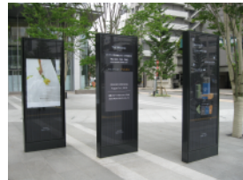
商業施設ビル外構サイン