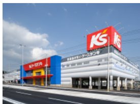
家電販売店外装サイン工事